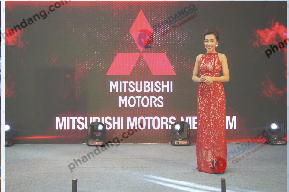
MC Phụng Yến Option 2